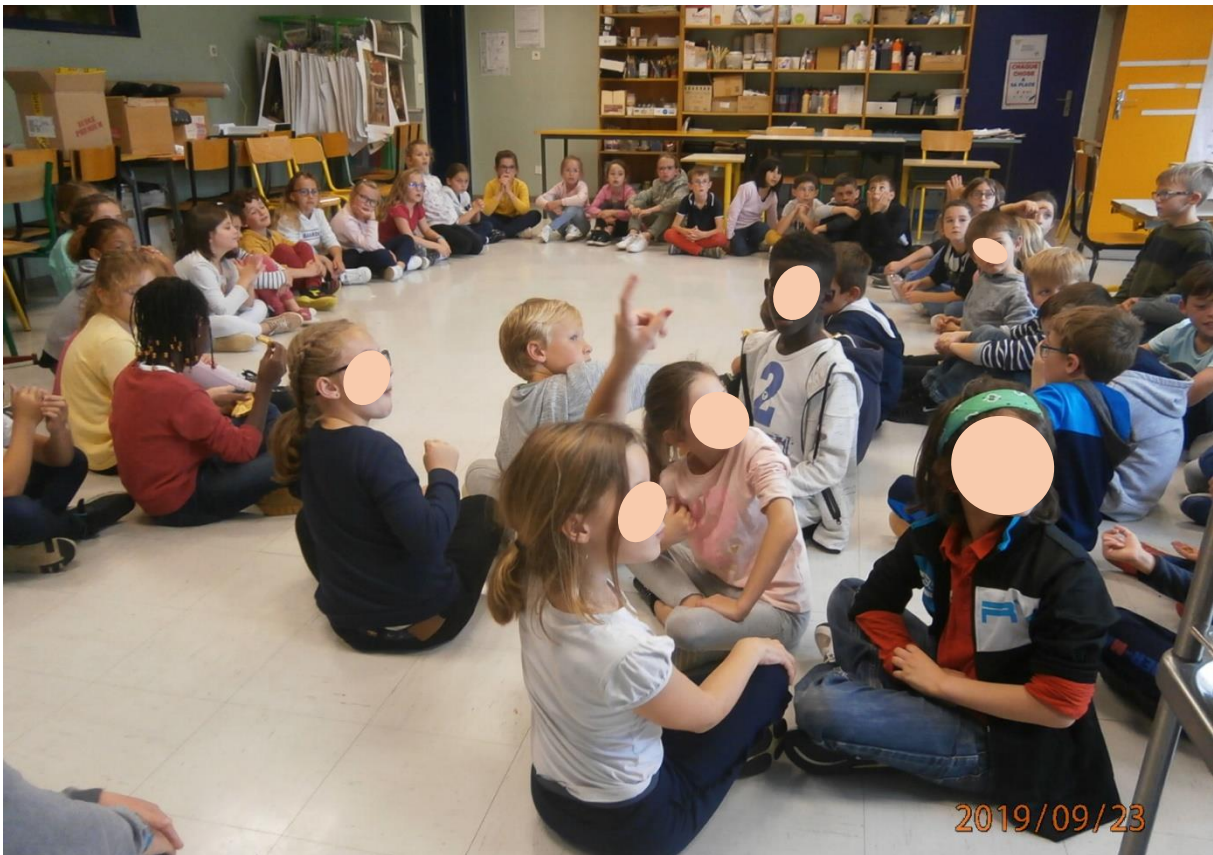
L'heure de la dégustation : nous nous sommes régalés.