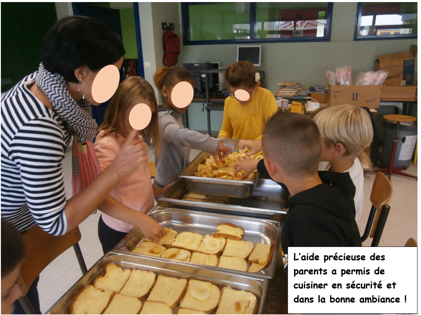
L'aide précieuse des parents a permis de cuisiner en sécurité et dans la bonne ambiance !